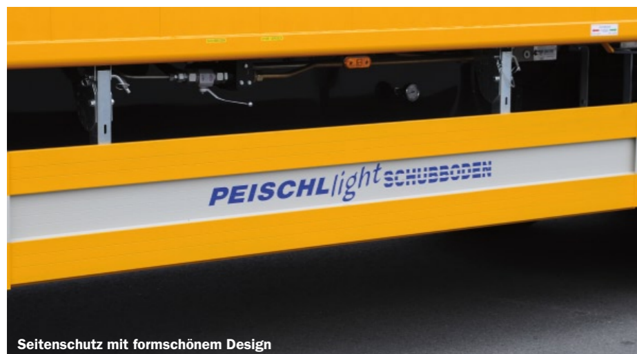
Seitenschutz mit formschönem Design