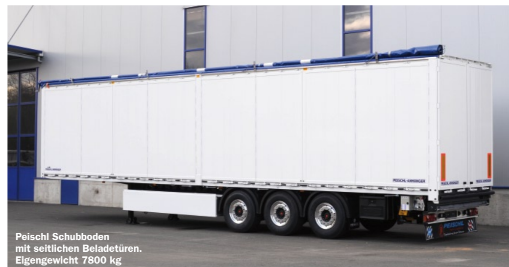
Peischl Schubboden mit seitlichen Beladetüren. Eigengewicht 7800 kg

Heute stellt das automatische Peischl Verdeck einen unverzichtbaren Bestandteil bei Hackgutschubboden dar. Im Bewegungsablauf des Daches liegen die wesentlichen Vorteile des Systems. Das Dach stellt sich nicht auf – wie beim Mitbewerber – sondern legt sich in einem speziellen kinematischen Bewegungsablauf an die rechte Seitenwand an. Bei starker Einwirkung von Windkräften stellt dies einen wesentlichen Vorteil dar. Außerdem ist das Eigengewicht des kompletten Dachsystems so optimiert, dass der gesamte Aufleger inklusive Verdeck bereits ab 7.600 kg angeboten werden kann.