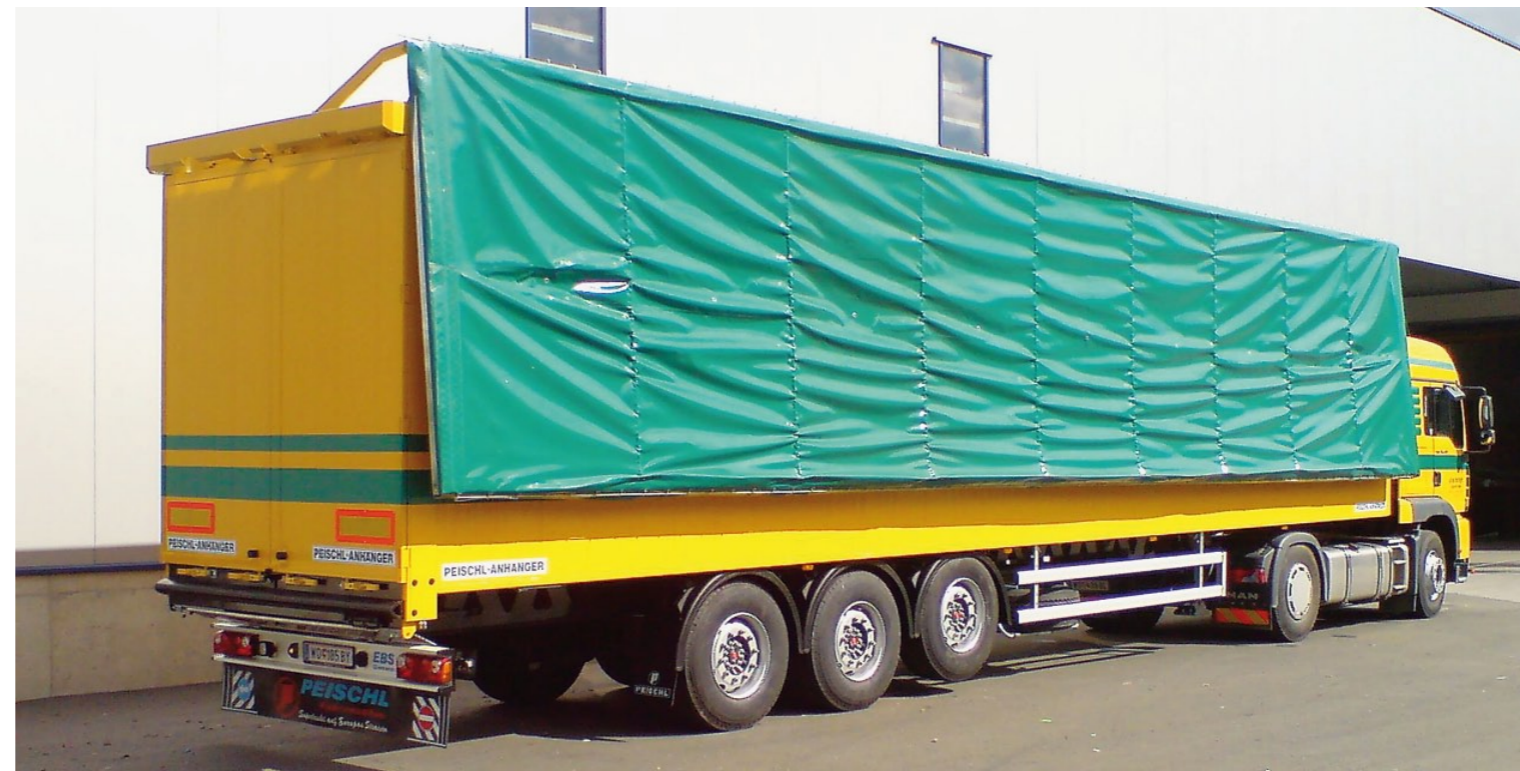
Patentiertes hydraulisches Verdeck für Hackguttransport. Eigengewicht 7.500 kg!

Mit dem patentierten vollhydraulischen Dachsystem für Schubbodenfahrzeuge hat das burgenländische Unternehmen seine Inno-