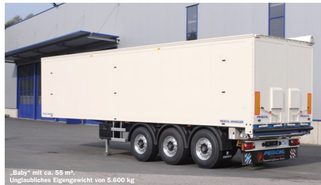
„Baby“ mit ca. 55 m 3 . Unglaubliches Eigengewicht von 5.600 kg

Wiener Straße 45 7551 Stegersbach Tel: 03326/524 65 www.peischl-fahrzeugbau.at